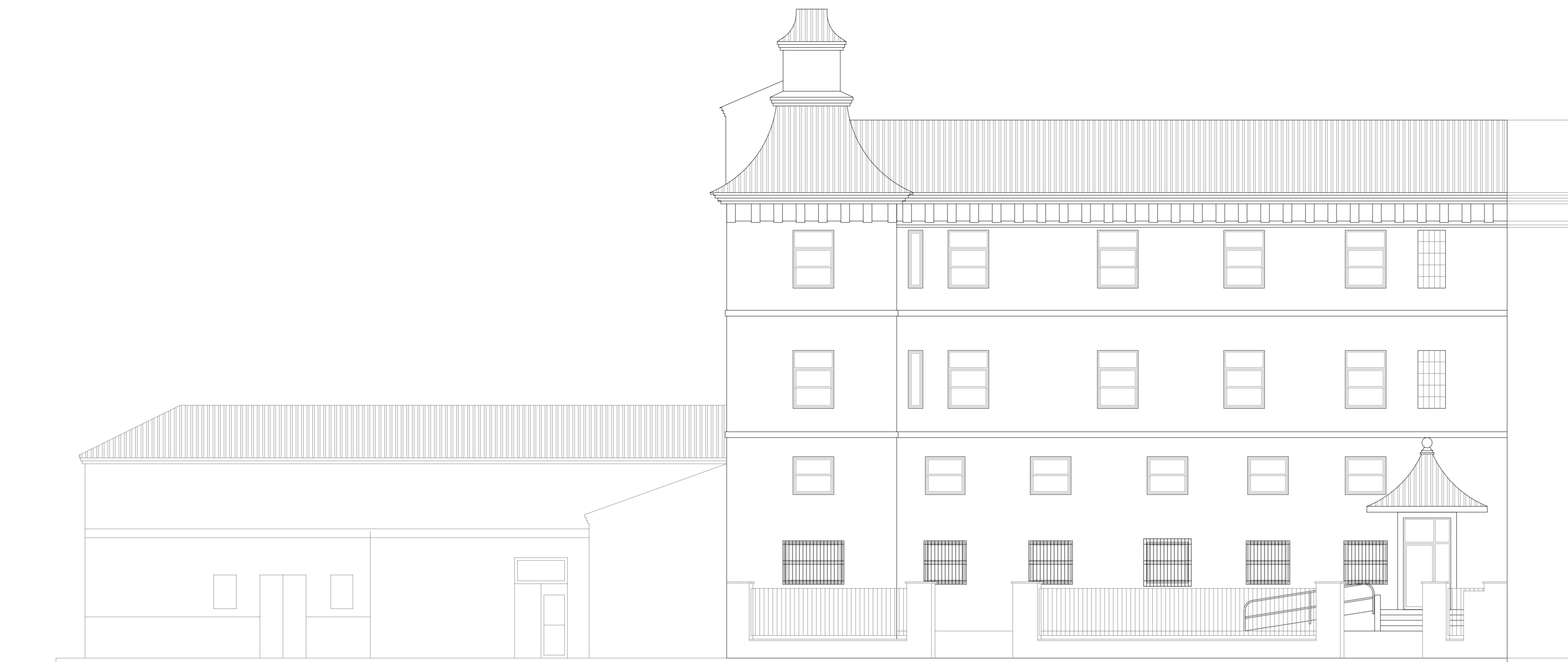
ALZADO POSTERIOR C/MONSEÑOR AMIGO